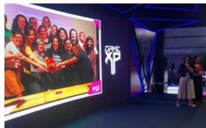
MULHERES NO MUNDO DOS GAMES - GAMEXP