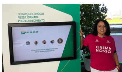
ESTANDE NA RIO2C COMO PROJETO DA PETROBRAS