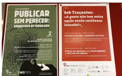
APRESENTAÇÃO SOB TRAÇANTES NO CES - COIMBRA