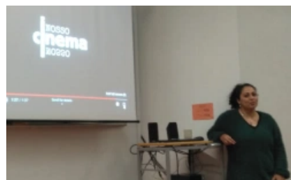
CONFERÊNCIAS SOBRE EMPREENDEDORISMO SOCIAL, ARTE E CULTURA LOCAL: FACULDADE DE ECONOMIA DA UNIVERSIDADE DE COIMBRA