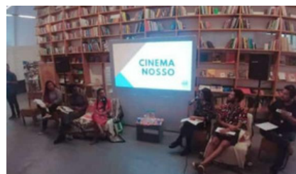
PALESTRA NO GALPÃO BELA MARÉ