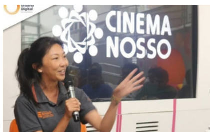
MITOLOGIA AFRICANA E A CULTURA DOS GAMES