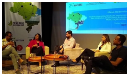
SEMIÁRIO PERSPECTIVAS FLORESTAIS LOCAL: RONDONIA