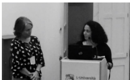
EMPOWER-SE WORKSHOP LOCAL: MALTA